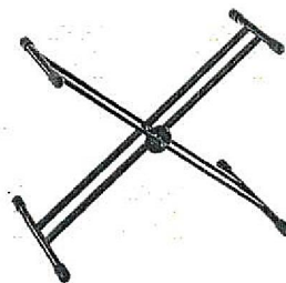
キーボードスタンドKS16